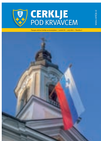
Slovenska zastava na zvoniku adersgaške cerkve ob dnevu državnosti