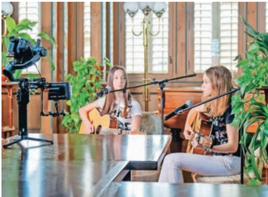
Koncert so nastopajoči vnaprej posneli v najimunitnejših stavbah cerkljanske občine – na gradu Strmol, v Hribarjevi vili in Petrovčevi hiši.