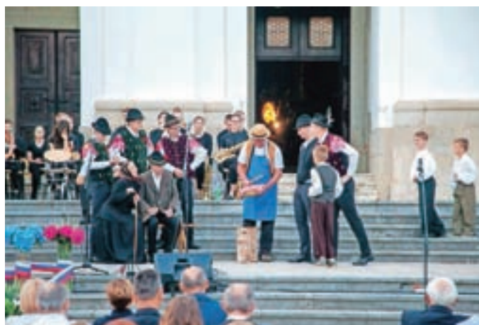
Prizor iz igre Cvetje v jeseni